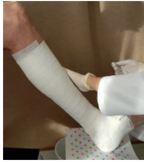
Abb. 13: Gips-Komponente (=Stiffness-Booster) „verstreichen“.