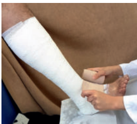
Abb. 16: Mit der textilelastischen Kurzzugbinde um die Ferse wickeln, ...