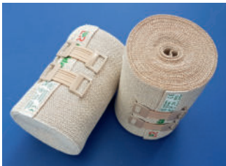
Abb. 1c: Kurzzugbinde (z.B. Rosidal® K, 8 cm x 5 m, Lohmann Et Rauscher).

pressionsmittels führt zur Entwicklung höchster, tiefenwirksamer Druckamplituden.