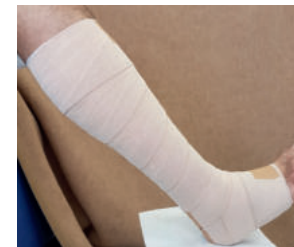
Abb. 23: Der Drei-Komponenten-Kompressionsverband ist fertig, und der Patient wird aufgefordert, ihn sofort 20 Minuten einzulaufen. Richtig angelegt sitzt er dann wie eine zweite Haut.