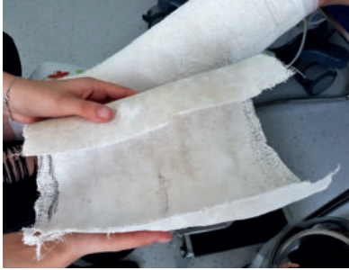
Abb. 28: Zu sehen ist die falten- und schnürrillenfreie Gipshülse, der Stiffness-Booster.