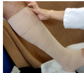
Abb. 21: ...und fixiert proximal z.B. mit Leukoplast® (BSN medical).