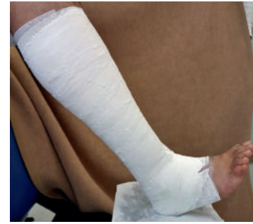
Abb. 15: Das Bein steht in vorgeschriebener Wickelhaltung für die dritte Komponente bereit.