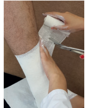
Abb. 5: Eine nicht nachgiebige Binde bringt es mit sich, nicht beliebig dirigierbar zu sein. Läuft die Binde „aus der Richtung“ – das heißt man müsste sie mit Zug und Falten in die richtige Tour zwingen – muss sie abgeschnitten und neu angesetzt werden.