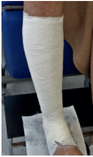
Abb. 12: Zinkleim-Verband und darüber liegende Gips-Komponente sind fertig gestellt.