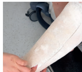
Abb. 26: ... dann das Bein im Zinkleimverband ...