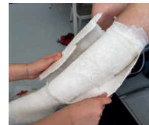
Abb. 27: ... heraus geschält.