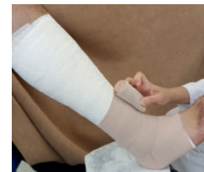
Abb. 19: Dann wickelt man den Unterschenkel...