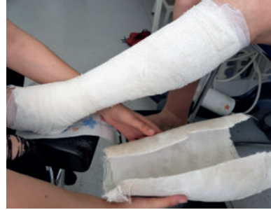
Abb. 29: Nun wird der ebenfalls falten- und schnürrillenfreie Zinkleimverband ...