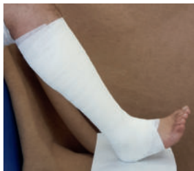
Abb. 6: Die erste Komponente ist fertig. Der nicht nachgiebige Zinkleim-Verband, in der Fischer-Methode angelegt, bildet eine ideale anschmiegsame Unterlage für die folgende Gipskomponente. Der Zinkleim stellt ein komfortables Gleitlager für die Gipsbinde dar. So kommt es zu keinerlei Hautirritationen, wenn der Patient sein vorgeschriebenes Laufprogramm absolviert.