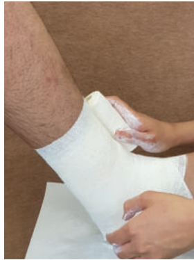
Abb. 3: Mit der Zinkleimbinde umfasst man als erstes, über dem Rist ansetzend, die Ferse, wickelt dann die Binde als eine Art acht von der Knöchelregion zum Mittelfuß und modelliert diese dann von dort über die Knöchelregion den Unterschenkel spiralig hoch.