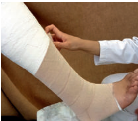
Abb. 20: ... spiralgig hoch ...