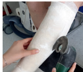
Abb. 25: Die Gips-Komponente wird ganz klassisch mit der oszillierenden Säge gespalten...