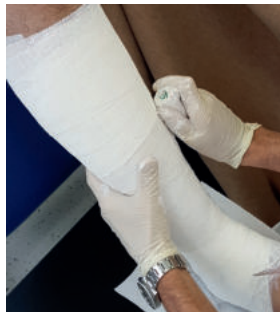
Abb. 10: Nicht ziehen, sondern anmodellieren.