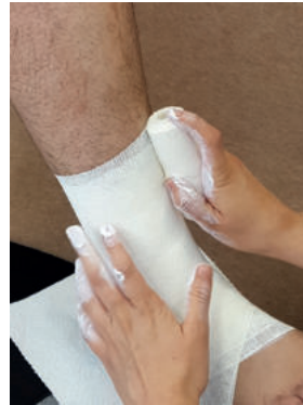
Abb. 4: Mit dem Bindenkopf wird unter gleichmäßigem Druck die Zinkleimbinde anmodelliert. Auf gar keinen Fall „am langen Zügel“ wickeln oder ziehen.