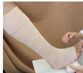
Abb. 22: Abschließend Anlage des „Querverbandes“ z.B. mit einer Porelast®-Binde 8 cm breit (Lohmann & Rauscher).