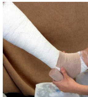
Abb. 17: ...um den Knöchel...