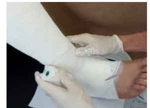
Abb. 9: Mit dem Bindenkopf, der als „Dampfwalze“ fungiert, wird die Gipsbinde unter zentripedalem Druck spiralig und überlappend den Unterschenkel hoch modelliert.