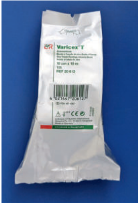
Abb. 1a: Zinkleimbinde (z.B. Varicex® T, 10 cm x 10 m, Lohmann Et Rauscher).