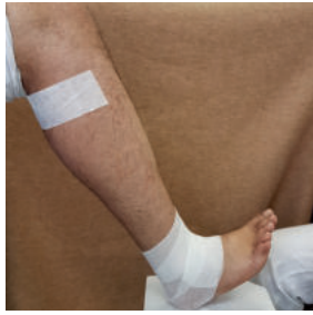
Abb. 2: Der Patient sitzt etwas erhöht dem Arzt gegenüber mit maximal dorsalflektiertem Vorfuß und leichter Supination. Zum Schneiden und Anreichen des Materials ist eine Assistenz zu empfehlen (z.B. Medizinische Fachangestellte). Nach Anlage des oberen Randes, etwa zwei Querfinger unter der Kniekehle, polstert man den Rist und die Sehnen der Fußhebergruppe sowie den Ansatzbereich der Achillessehne mit Polsterwatte und einer Mullbindentour um den Knöchelbereich ab.