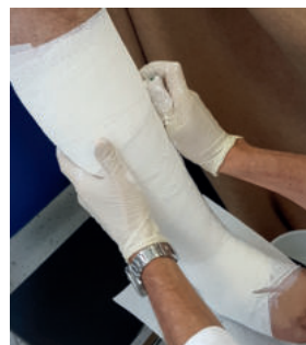
Abb. 11: Auch die Gipsbinde wird in der Fischer-Methode angelegt. Sollte sie auch „aus der Richtung laufen“, muss sie abgeschnitten und neu angesetzt werden, um Schnürrillen und Falten auszuschließen.