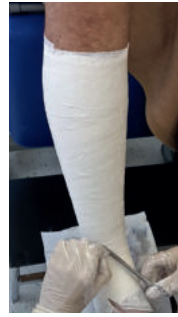
Abb. 14: Auch die Gips-Komponente bekommt einen Entlastungsschnitt frontal 1-2 cm am distalen Ende.