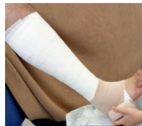
Abb. 18: ... und um den Mittelfuß.