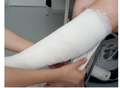
Abb. 30: ... in klassischer Form abgewickelt.