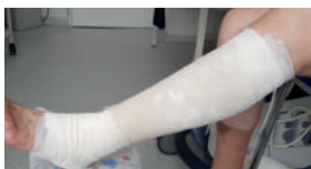
Abb. 24: Nach drei bis vier Tagen erfolgt in der Regel der Verbandwechsel. Die Beine sind im entstauteren Zustand viel schlanker, sodass „nachgefasst“ werden muss. So sieht ein vier Tage alter Drei-Komponentenverband nach Entfernung der Idealbinde aus.