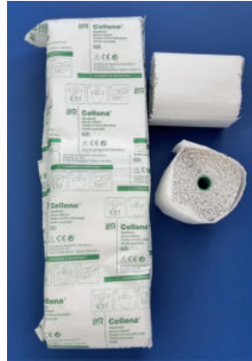
Abb. 1b: Gipsbinde (z.B. Cellona®, 8 cm x 4 m, Lohmann Et Rauscher).